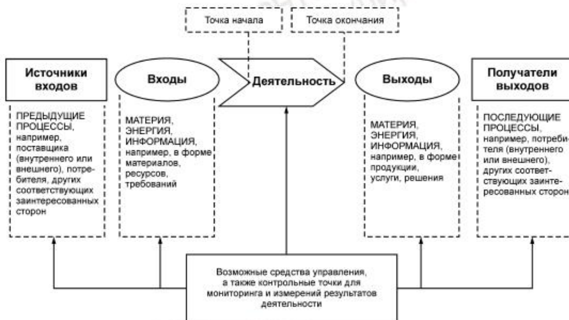
Рисунок 1 — Схематичное изображение элементов процесса

Рисунок 1 дает схематичное изображение любого процесса и иллюстрирует взаимосвязь элементов процесса. Контрольные точки мониторинга и измерения, необходимые для управления, являются специфическими для каждого процесса и будут варьироваться в зависимости от соответствующих рисков.